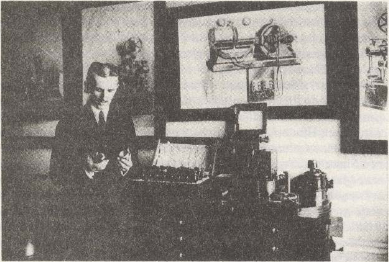
Tesla in seinem Laboratorium in New York

Im Hinblick auf dieses Ziel ist es von größter Bedeutung, den Austausch von Gedanken und gemeinsame Treffen zu unterstützen.